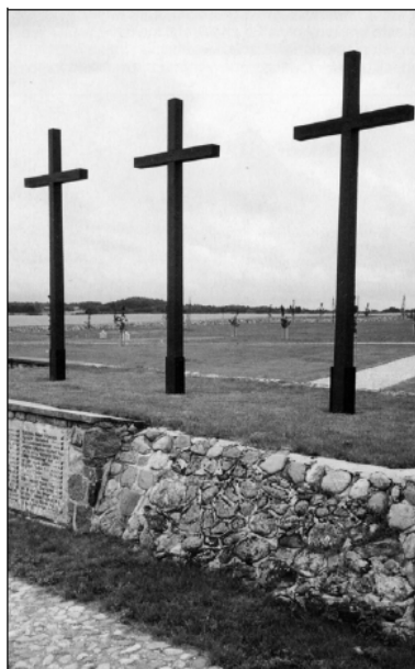
Ehrenfriedhof Bartossen, Kreis Lyck (Golgatha Ostpreußens)

Bereits seit Oktober 2008 ist der Bundesregierung bekannt, daß bei Abrißarbeiten auf dem Gelände des ehemaligen „Polnischen Hauses“ im westpreußischen Marienburg die sterblichen Überreste von 1.800 Menschen gefunden wurden. Auch das Auswärtige Amt – genauer dessen Rechtsabteilung und das Referat 503 (Kriegsfolgen) – wurde von dem Fall in Kenntnis gesetzt. Weder Bundesregierung noch Auswärtiges Amt haben sich bis zum heutigen Tage öffentlich zu den Vorkommnissen in Marienburg geäußert.