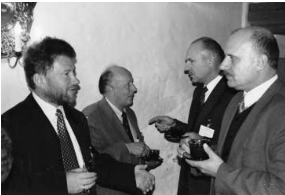
Die wichtige Diskussion zur Vertreibung wird auch in den Pausen fortgesetzt.

Osobiście chcę kontynuować moją w pracę w tym duchu. Jestem pewien, że także w przyszłości będę przy tym otrzymywał wsparcie od moich krajan, którzy wskutek wypędzenia stali się moimi towarzyszami doli i niedoli.