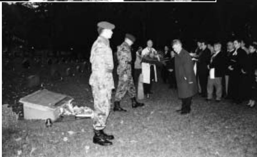
Elbings OB Slonina entschuldigt sich für polnische Aggressionen in Elbing in der Nachkriegszeit.