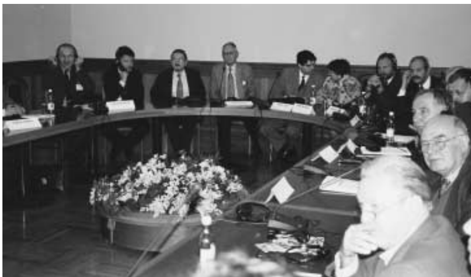
Kongreßteilnehmer am runden Tisch

Mir scheinen diese Worte, obwohl vor fast 130 Jahren ausgesprochen, gerade hier in Elbing noch heute hochaktuell zu sein. Für das Gelingen der Verwaltungsreform in Polen kann es deshalb aus unserer Sicht keine Alternative geben. Ich gehe davon aus, dass gerade die Landsmannschaften in Deutschland dazu geeignet sind, diese Entwicklung zu unterstützen. Sie haben ein Interesse daran, dass auch ihre ehemalige Heimat zu blühenden Landschaften entwickelt wird. Und enge Beziehungen zwischen deutschen und polnischen Kreisen und Gemeinden sind eine Garantie dafür, dass dies gelingen kann. Hierfür ist das Engagement der landsmannschaftlichen Vereinigungen gefragt.