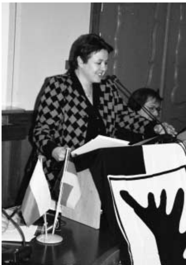
Czesława Ostrowska, die Direktorin des polnischen Präsidialbüros, verliest das Grußwort des Präsidenten der Republik Polen