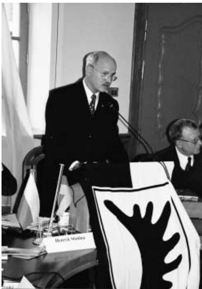
Der Sejmabgeordnete Witold Gintowt- Dziewaltowski wirbt für die EU-Osterweiterung