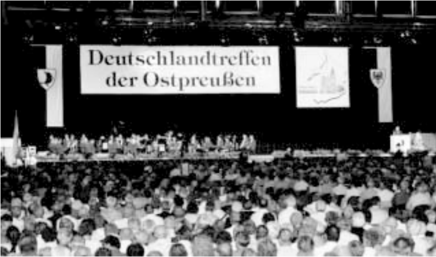
Bildete auch in Leipzig den Höhepunkt der Veranstaltung: die Großkundgebung in der überfüllten Haupthalle des Messegeländes mit dem Einmarsch der Fahnenstaffel

Den eigentlichen Aufrechtern, den Verschweigern der Wahrheit in der Bundesrepublik, in Polen und Tschechien und wo immer sie leben, sei ins Stammbuch geschrieben: Wie immens auch immer die Verbrechen waren, die Deutsche zu verantworten haben, nichts, aber auch gar nichts entschuldigt die Verbrechen an Deutschen. Jede Schuld steht für sich und bedarf der Aufarbeitung. Wir Deutsche haben bis ins Detail aufgearbeitet – die Aufarbeitung der Verbrechen an Deutschen steht noch aus.